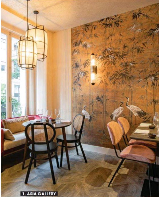
1. ASIA GALLERY