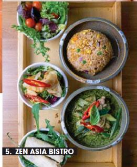
5. ZEN ASIA BISTRO